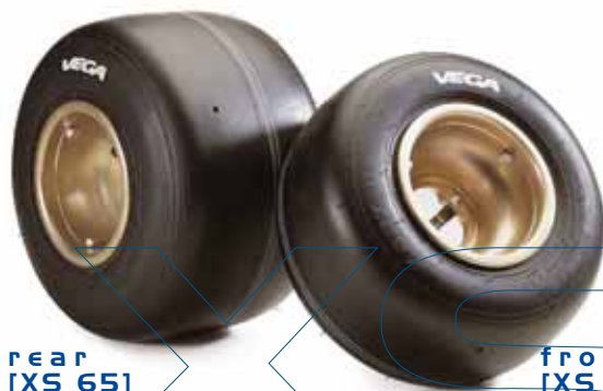
rear [XS 65]